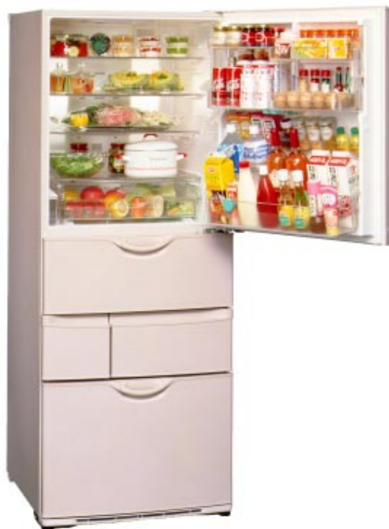
『NR-E46V1』有効内容積460L 標準価格(税別)265,000円

しかも、野菜室を最も使いやすい腰の位置(97cm)にレイアウトし、引出し奥の風路形状の改善により、業界最大の底面積を実現。引出しストロークを業界最長の45cmまで伸ば