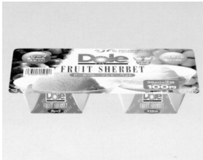
『Dole フルーツシャーベット グレープ&マスカット《デュアルパック》』 100円 90ml x 2コ

中身は素材にこだわった本格的なフルーツシャーベット。グレープは「コンコード品種」の果汁を45%使用し、さらに粒子の細かい氷粒を混ぜ入れることによりぶど