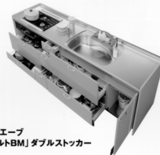
サンウエーブ 「シェルトBM」ダブルストッカー

キッチン扉にお手入れが簡単で高級感をかもし光沢感ある高圧メラニン鏡面扉を使用した「676シリーズ」を3カラー、無垢材を使用した高級木製扉を使用した「677シリーズ」を2カラー用意(6月21日発売)。さらに、電子レンジや炊飯器など家電製品の収納に便利な、家電収納キャビネットも6月21日より発売です。