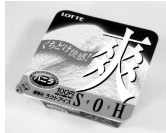
写真 『爽(SOU)』バニラ味 価格 100円

また、食べ応えがぎっしり詰まったモナカアイス『モナ王』にひとつで2つのフレーバーが楽しめる チョコ&バニラ 味が新登場。割り方によって、チョコ、チョコ&バニラ、バニラの3通りが楽しめます。