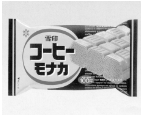
『雪印 コーヒーモナカ』 100円